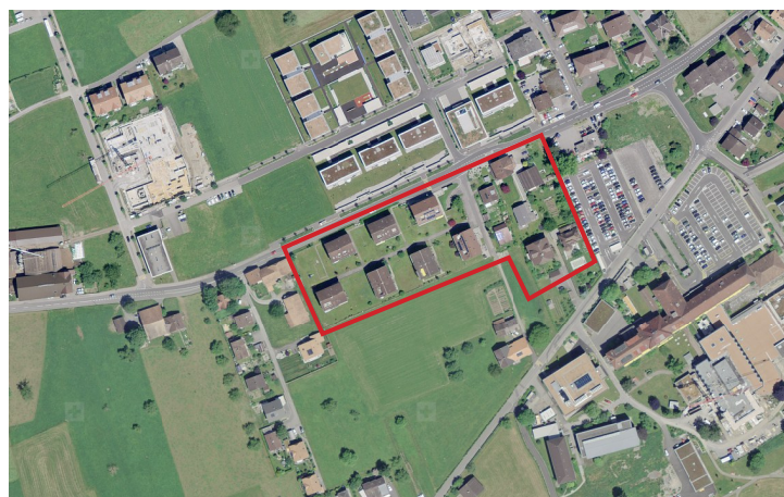
Orthophoto: © swisstopo