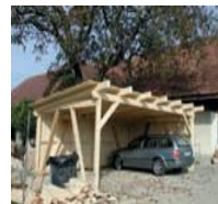
Abri à voitures ouvert sur deux côtés