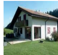
Vitrage d'un renforcement de bâtiment