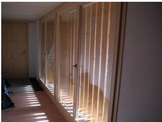
Zugang innerhalb Hocheinfahrt

Bei der Erstellung von neuen Zufahrten wird die Verpflichtung zur Nutzung als Dauerwohnsitz als Nebenbestimmung in den Ausnahmeentscheid aufgenommen und im Grundbuch angemerkt.