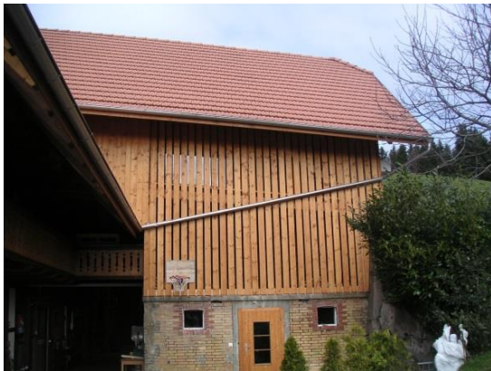
Verbretterung Wand bei Hocheinfahrt