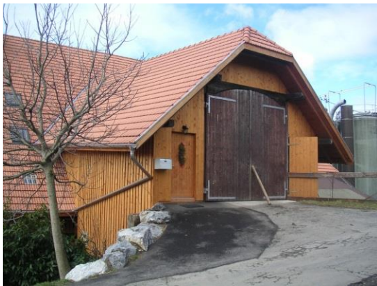
Wohnungszugang über Hocheinfahrt