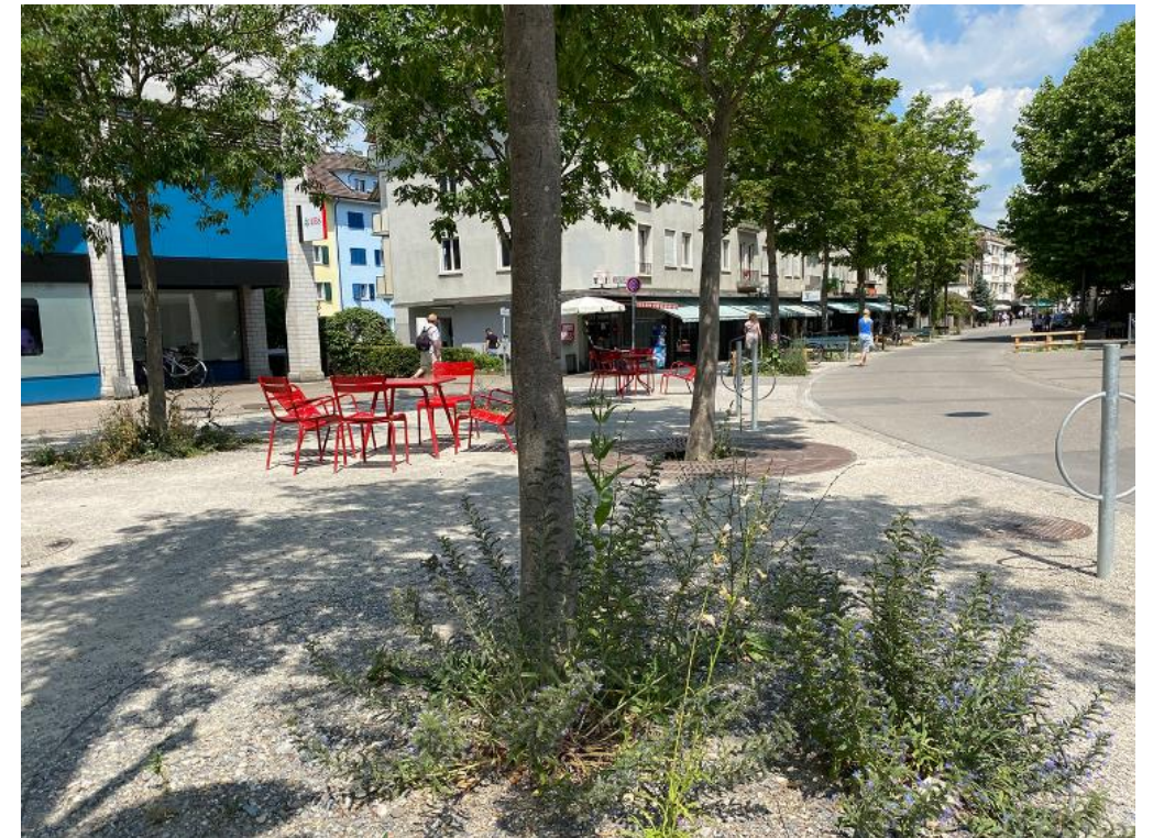
Valorisation de la zone piétonne à Bümpliz