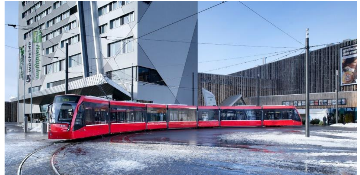
Tram dans le PDE de Berne Brünnen

Valeur ajoutée brute (VAB) par équivalent plein temps (EPT) dans les PDE et dans le reste du canton de Berne