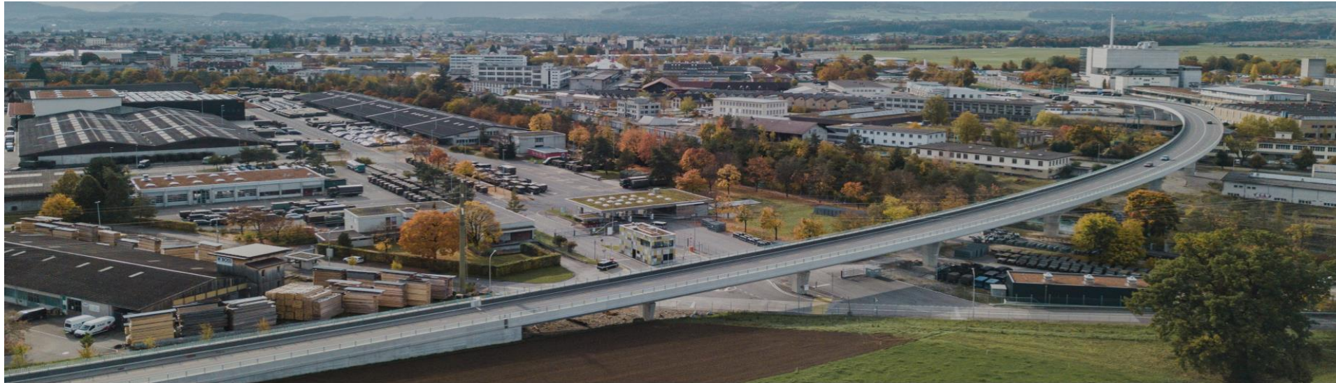
PDE de premier plan de Thoun Nord